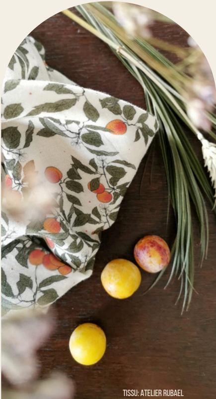
TISSU: ATELIER RUBAEL